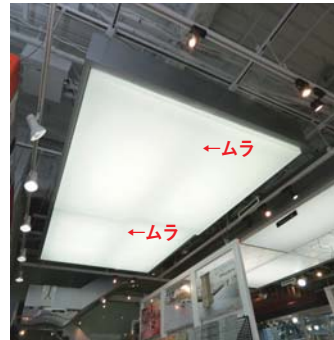
蛍光灯を使用したシステム天井用照明器具。光のムラが発生している。

採用したLEDは、通常よりハイパワーであり、非常に明るいので、球数を少なく設計できます。さらに、特殊な広角レンズを使用しており、光がワイドに広がることでシェード面を均一に明るく照らします。高品質な光幕天井システム開発のため、ハイパワーで明るくシェード面を照らすLEDを選びました。